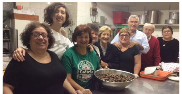
Comité "San Martiño" 2017