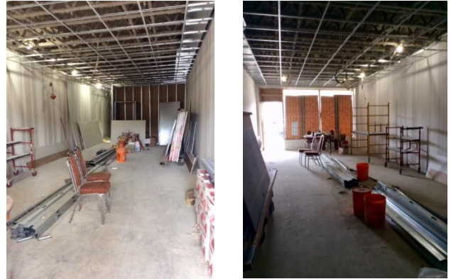
Sala principal y bar.

Finalmente las obras ya han comenzado en el local. Los planos fueron aceptados, los permisos otorgados, y algunas restricciones que habían con el Covid-19 fueron ya dadas de alta. Por lo tanto esperamos que para el comienzo de otoño ya estemos disfrutando del local.