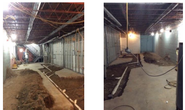
Sotano (oficina, aseos, trastero)