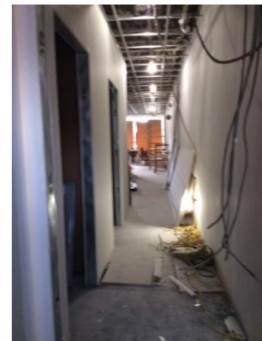
Entrada a cocina y aseo para minusválidos.